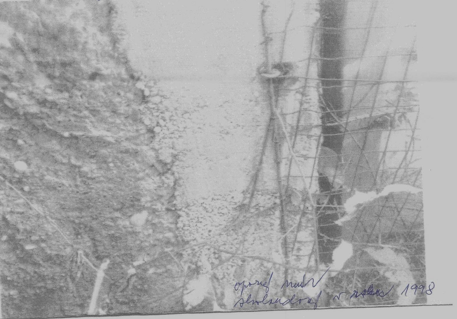
oponeel muid stahlsudooft ~ 2000 1998