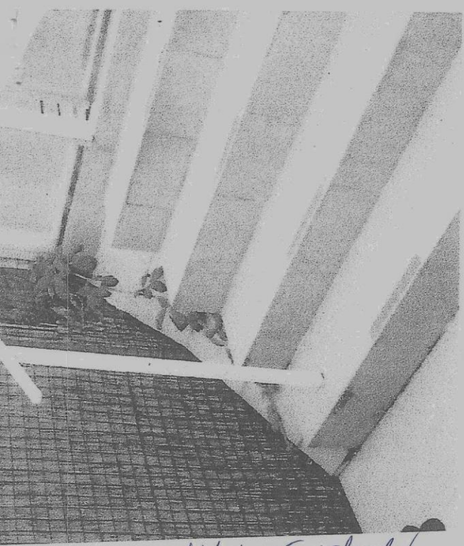
nikkelpipe rindhof dt beger