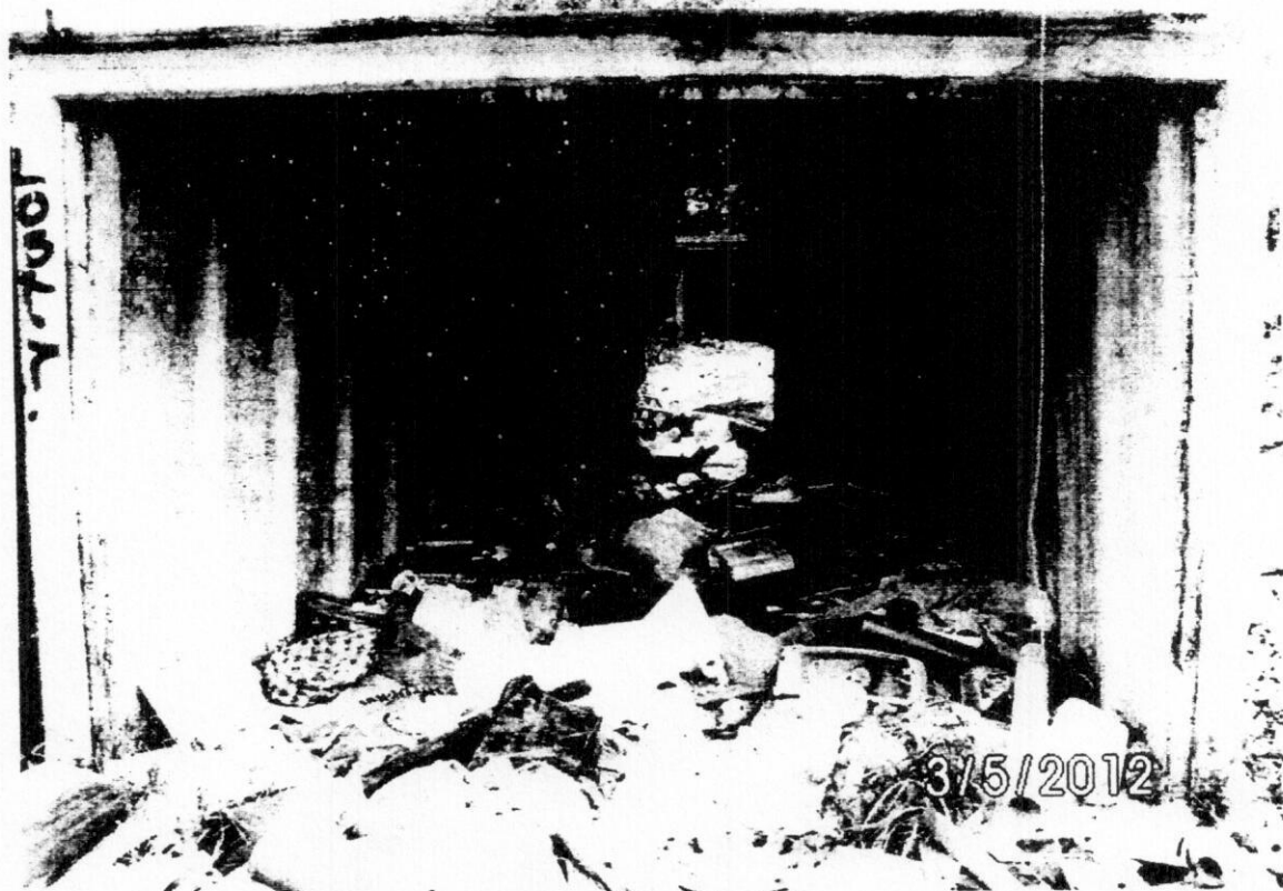
obr.2 Snímok garáže na parc.č.12780/152