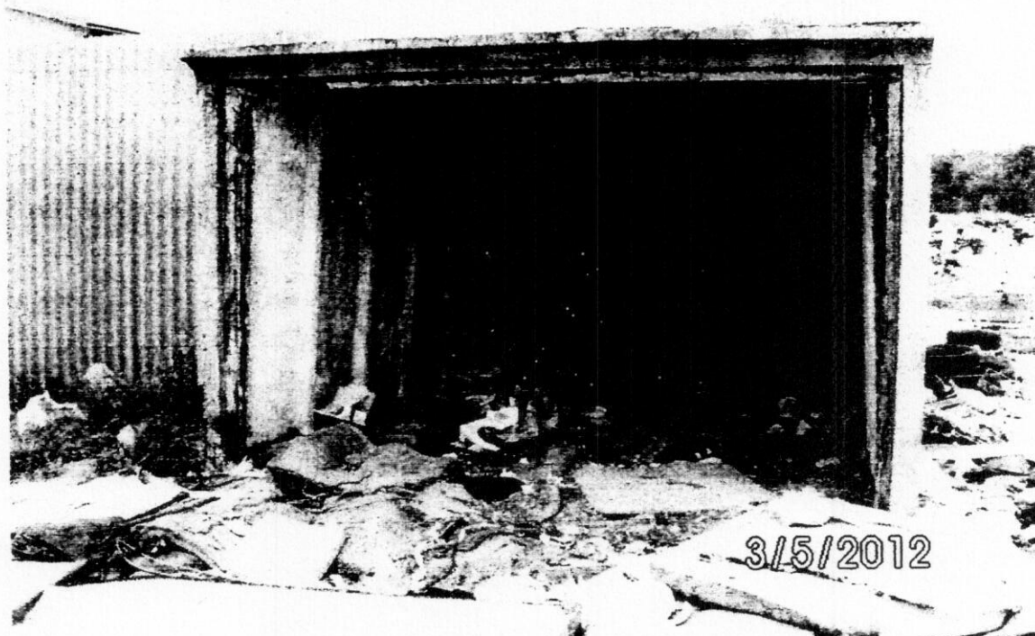
obr.1 Snímok garáže na parc.č.12780/170