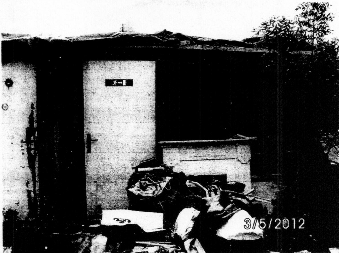
obr.5 Snímok garáže na parc.č.12780/79