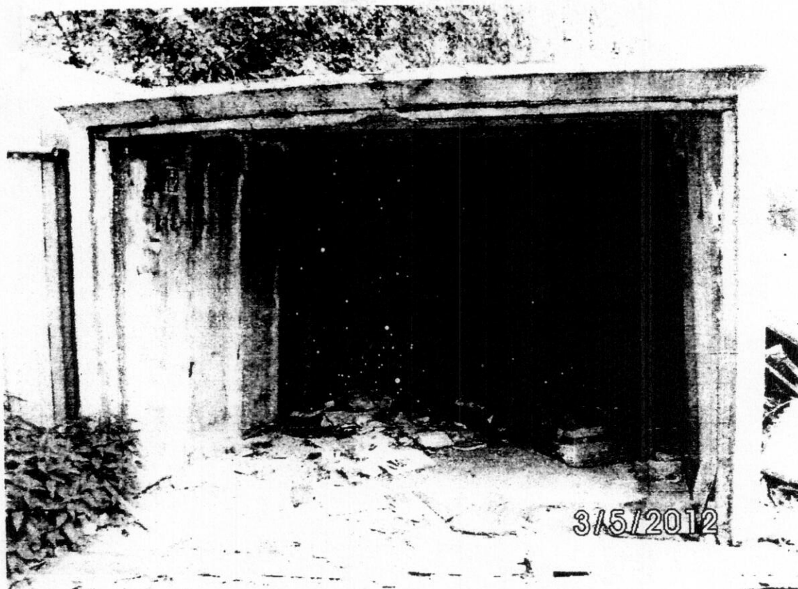
obr.3 Snímok garáže na parc.č.12780/134