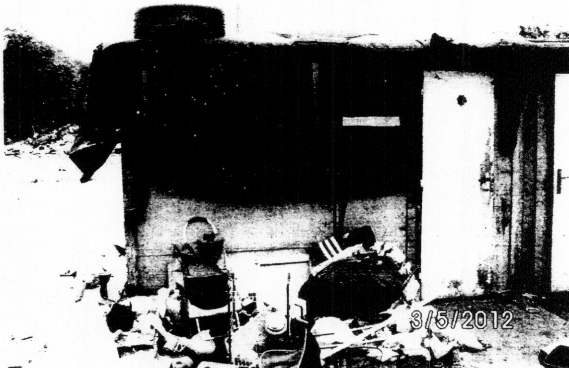
obr.6 Snímok garáže na parc.č.12780/78