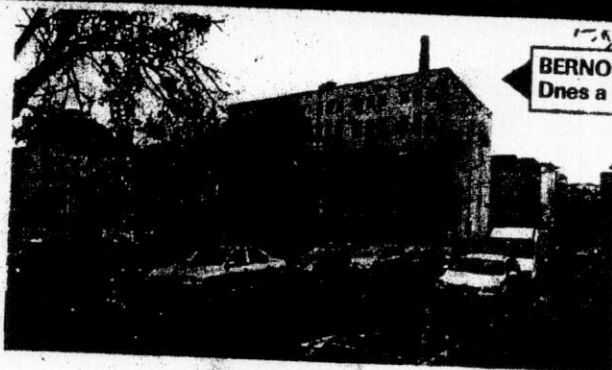
BERNOLÁKOVA: Dnes a budúcnosť.